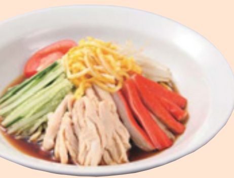
「天下一」「冷やし中華 | 680円